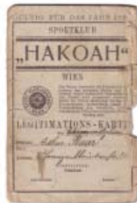
Carte de membre du Club Hakoah , Vienne, années 1920.

L'Hakoah de Vienne (« la force » en hébreu) est fondée en réaction à l'interdiction faite aux athlètes juifs d'intégrer les clubs autrichiens.